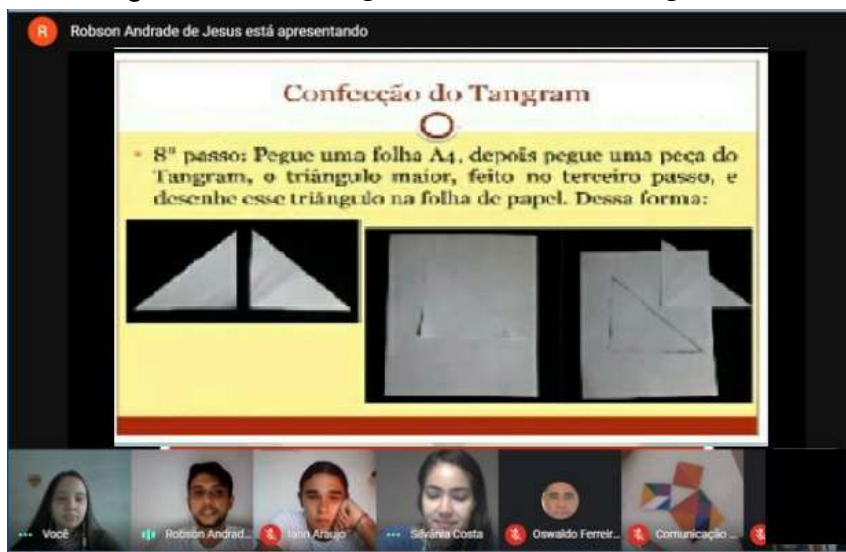
Figura 2: Oficina “Tangram e o Teorema de Pitágoras”