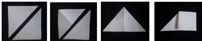
Figura 1: Processo de construção do Tangram

Uma das folhas de papel foi usada para confeccionar o Tangram a partir de técnicas de marcações, dobraduras e recortes (Figura 1) e a outra foi usada para criar um molde para que os participantes pudessem ser orientados na hora de usar o Tangram, criando quadrados cujos lados possuíam as mesmas medidas dos catetos e da hipotenusa do maior triângulo do Tangram.