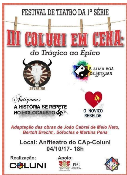
Figuras 11 e 12: Cartaz de divulgação do Festival e Modelo da camisa do Festival

fizeram o cartaz do evento. A divulgação se deu principalmente nos meios virtuais: as redes sociais (Facebook, Instagram e Whatsapp). Próximo ao dia do festival, os alunos postavam fotos das preparações das apresentações e faziam chamadas convidativas os espectadores. Foi feita também uma camisa para os participantes do Festival III Coluni em Cena.