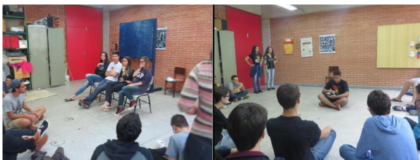
Figuras 1 e 2: alunos nas aulas de improvisação teatral