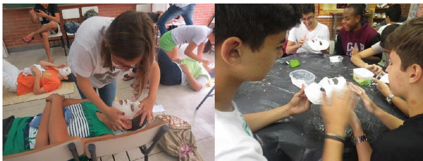
Figuras 9 e 10: alunos nas oficinas de máscaras