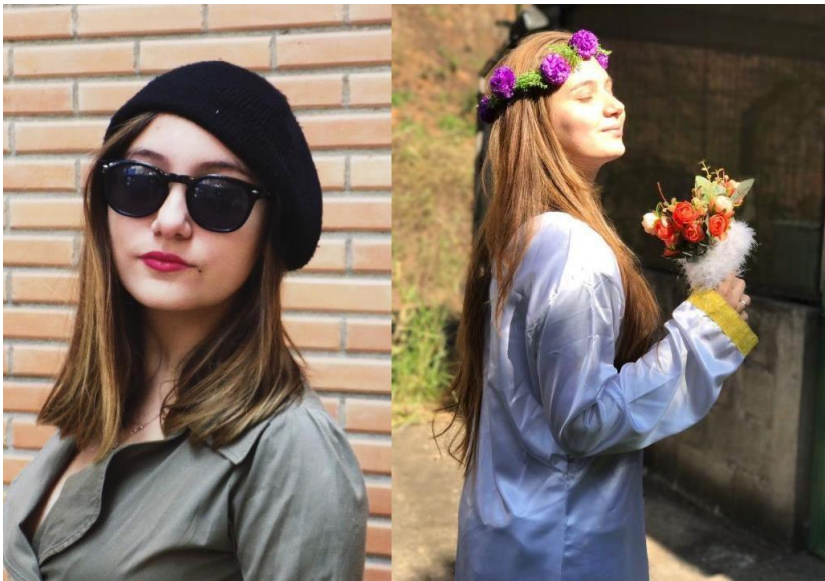
Figuras 3 e 4: criação do personagem a partir do figurino

próprio ator em relação à realidade do espetáculo. Os mínimos detalhes do figurino trazem uma composição para a cena que caracteriza os personagens em determinado tempo, lugar e outras especificidades. As oficinas de figurino foram extremamente importantes para que o processo de ensino/aprendizagem do teatro fosse completo e mais produtivo. Cada turma foi dividida em grupos de quatro alunos, que deveriam montar um figurino e criar uma história a partir deste, de forma a surgir um personagem.