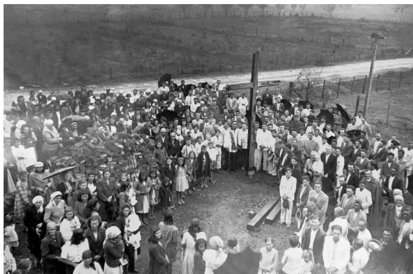
Figura 1: Missões de Igreja, déc 40, bairro Mãe Luiza em Criciúma-SC.

A primeira fotografia que nos propormos a analisar (Figura 1) retrata um momento visivelmente religioso, com uma cruz que é central na imagem. A comunidade italiana dessa região tem fortes laços com o catolicismo e a população era muito praticante. Esta crença, de diversas formas, era transmitida de geração em geração, deveria fazer parte de todos os âmbitos da vida pessoal e familiar, e por isso, era reforçada cotidianamente.