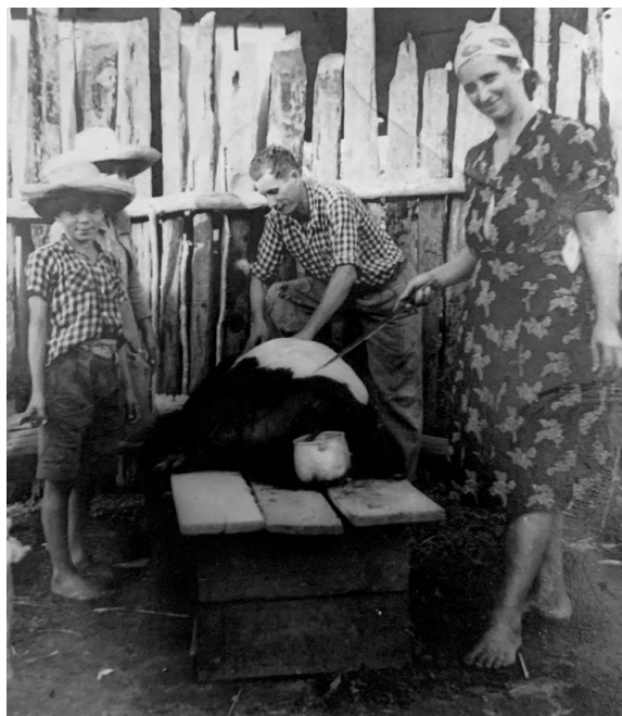
Figura 4: Trabalho, sem data, Criciúma-SC.

A família para a comunidade italiana era à base de tudo e até mesmo a base para a sobrevivência. Era a unidade consumidora e, sobretudo produtiva (Figura 4), envolvendo todos os membros do núcleo familiar e às vezes agregados, como tios e primos. Homens e mulheres realizavam uma gama grande de atividades, mas as mulheres eram as mais sobrecarregadas, já que, além do trabalho com a lavoura e com os animais, a demanda das tarefas doméstica e o cuidado com os filhos era grande. Assim, apesar do trabalho feminino ser de extrema importância para as dinâmicas diárias do núcleo familiar, existia um sentimento de desqualificação acerca do trabalho doméstico, sentimento esse que não estava escancarado dentro das relações.