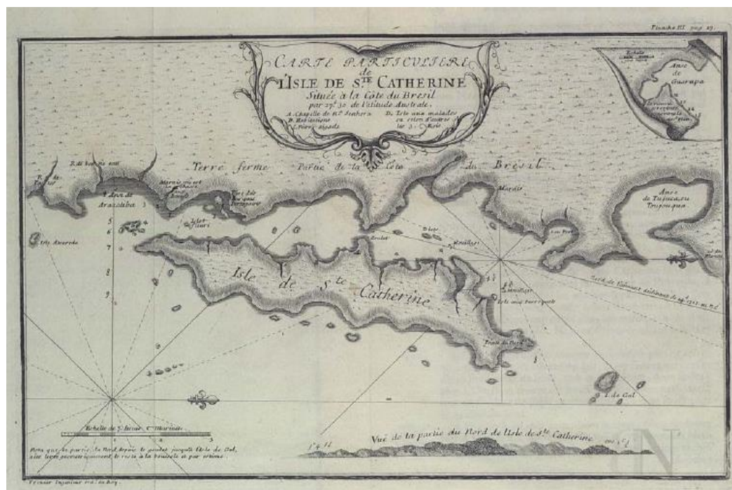
Figura 2: Carta Particular da Ilha de Santa Catarina – Frézier (1712)

Fonte: Amédée François Freizer. Carte particuliere de l'Isle de Ste. Catherine: située à la Côte du Bresil par 27.d 30 de l'atitude Australe 18 ,