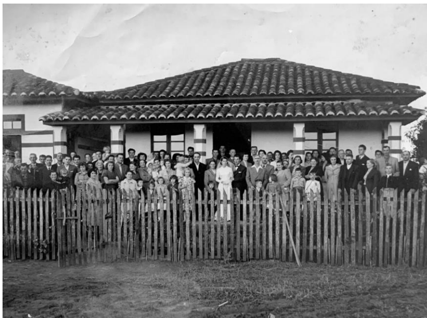
Figura 6: Festa de Casamento, 12 de jul. 1955, Criciúma-SC.

A festa de Casamento (Figura 6) é a sequência do momento retratado na foto anterior, agora mostrando o casal e seus convidados. Os retratos feitos com todos os convidados são objetos de exibição e era marco de afirmação e apresentação do novo casal a comunidade, além de ser uma forma de sociabilidade entre a vizinhança. A festa era geralmente realizada na casa do noivo, ou onde se pudesse abrigar e servir o máximo de pessoas, visto que, as festas de casamento de grande sucesso eram vistas como uma forma de receber ou manter o status perante as outras famílias.