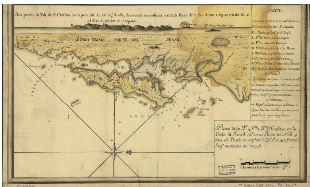
Figura 1: Mapa das Casas, Construções e Fortificações que Envolviam o Complexo da Ilha de Santa Catarina no Século XVIII

16