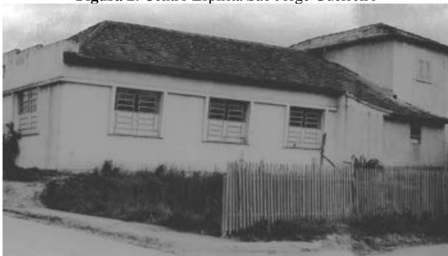
Figura 2: Centro Espírita São Jorge Guerreiro