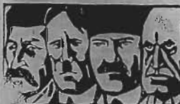
Stalin, Hitler, Kemal Pacha e Mussolini

BERLIM, 27 (C. E.) — Tem causado grande sensação aqui o artigo que o conhecido publicista judeu Emil Ludwiz escreveu para a imprensa norte-americana, sob o titulo «Os quatro homens do seculo», em que estuda as personalidades e as atações de Stalin, Hitler, Kemal Pacha e Mussolini.