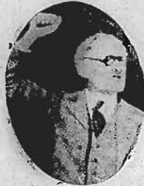
Ministro Mac Donald

Proseguindo as demarches para o fim de contornar o impasse imminente, a Inglaterra está evidentemente preparada para reconhecer ao Japão o direito de paridade na hipótese desse país concordar em não construir novas unidades dentro de um periodo determinado. Em outras palavras, seria assegurado ao governo de Tokio o direito de possuir futuramente a mesma tonelagem que a Grã-Bretanha e os Estados Unidos no que concerne aos navios capitais.