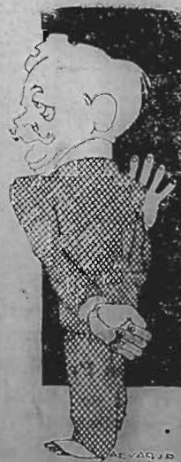
Sr. Epitácio Pessoa