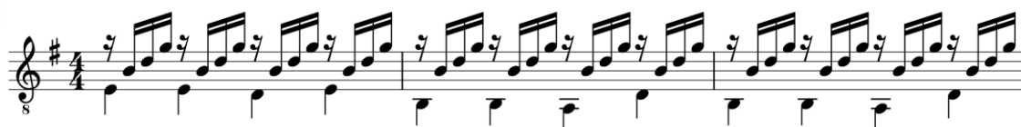
Fig. 1. Menino : introdução

De início, chamo atenção para a introdução , tal como se ouve no fonograma. Apesar de sua gênese ser um elemento do arranjo – e não da composição, por conseguinte –, no fluxo de seu devir, ela passou a ser indissociável da própria canção. Logo, basta alguém tocar essa melodia no baixo acompanhada do arpejo do acorde menor com sétima para que a pessoa que ouve (e conhece a música, evidentemente) relembre das reflexões estéticas enformadas na gravação original.