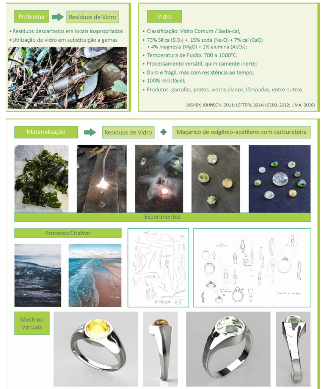
Figura 2: Projeto com resíduos de vidro do aluno Lucas Schneider. Fonte: Autores.

No projeto do aluno, a experimentação consistiu na quebra de resíduos de vidro de soda-cal para serem fundidas por meio de um maçarico de oxigênio-acetileno, com carbureteira, formando gotas de vidro fundido possuindo cores variadas. No processo criativo, as peças foram delimitadas como anéis para compor uma coleção, e foi buscado como tema de inspiração geometrias longilíneas, além de aspectos de fluidez e escoamento, como o caminho das ondas do mar, partindo para a geração de alternativas. Durante esta etapa, os locais onde as “gemas” de vidros iriam ser alocadas foram levados em consideração, devido à fragilidade intrínseca do material. Com isto, a parte metálica dos anéis foi projetada para envolver o vidro, protegendo-o de possíveis impactos.