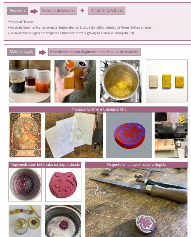
Figura 4: PProjeto com resíduos de madeira e tingimento natural do aluno Gustavo Zottele Freitas.

Com os experimentos dos tingimentos desenvolvidos, iniciou-se o processo criativo e a geração de alternativas com a temática do Art Nouveau, envolvendo formas curvilíneas e arabescos. Optou-se pela fabricação de um pingente para compor a coleção de joias, onde seria acrescentada a prata (Ag 950). O pingente foi modelado em software 3D, e a madeira foi usinada, em baixo relevo, para ser acoplada à parte metálica. Para a fabricação da prata, utilizou-se o modo artesanal, através de fundição, laminação no formado chapa, recorte com arco de serra, e acabamentos com limas e lixas de granulometrias variadas