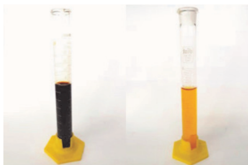
Figura 03 - Determinação de impurezas orgânicas, (a) Solução após contato com o lodo de ETA (b) Solução padrão.

Na Figura 03, encontra-se o resultado do ensaio de impurezas orgânicas. A análise desse ensaio se faz por meio da comparação entre a coloração da solução após contato com o material utilizado e a solução padrão de acordo com a ABNT NBR NM 49:2001. A cor mais escura que a solução padrão indica a possibilidade do agregado ser portador de compostos orgânicos nocivos.