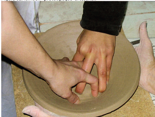
Figura 02: Idifidek - prototipação artesanal.