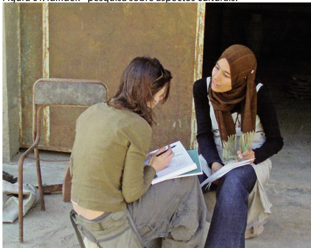
Figura 01: Idifidek - pesquisa sobre aspectos culturais.

Fonte: Lotti, G. Teritori & Coessiononi, 2010. p.114.