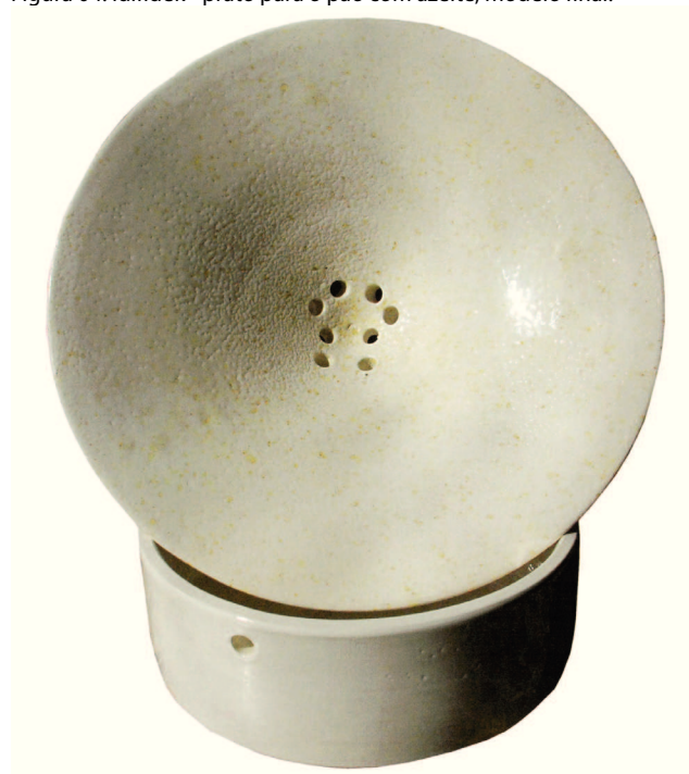
Figura 04: Idifidek - prato para o pão com azeite, modelo final.