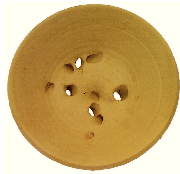
Figura 03: Idifidek - prato para o pão com azeite, produção de artesanato local.