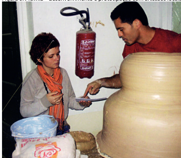
Figura 07: Tawila - desenvolvimento e prototipação com artesãos locais

Fonte: Lotti, G. Teritori & Coessiononi, 2010. p.118.