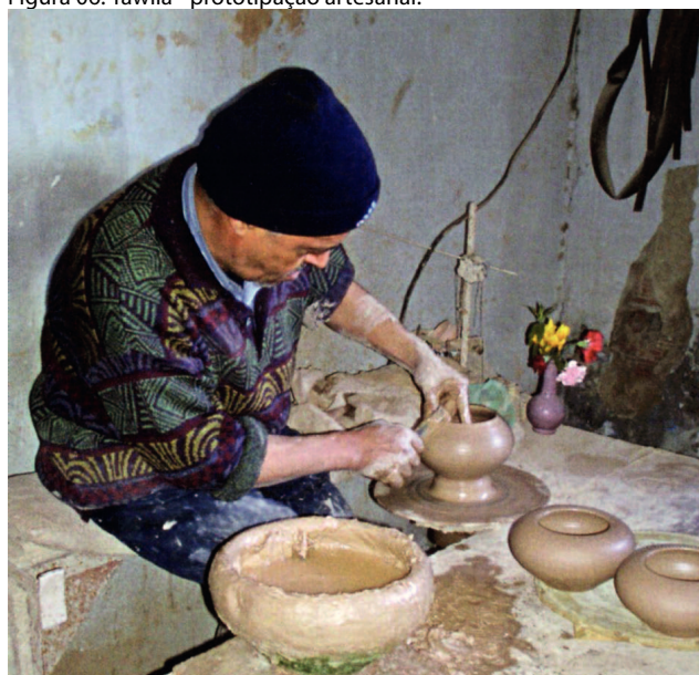
Figura 06: Tawila - prototipação artesanal.

Fonte: Lotti, G. Teritori & Coessiononi, 2010. p.118.