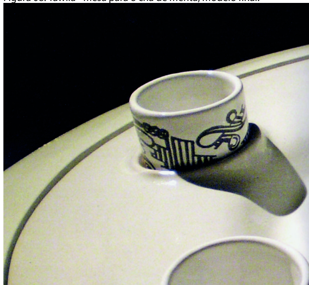
Figura 08: Tawila - mesa para o cha de menta, modelo final.

Fonte: Lotti, G. Teritori & Conessioni, 2010. p.119.