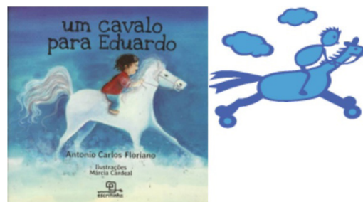
Figura 1 - Ilustração e releitura da obra

Fonte: ELIANE DEBUS (2013); Autoria própria (2015).