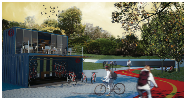
Figura 3. Modelo Virtual do Projeto Container Bike

Fonte: Elaborado pelos autores com base no projeto realizado.