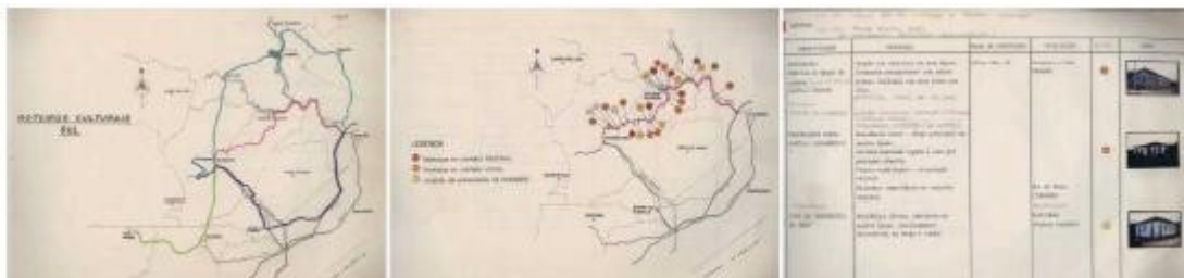
Figura 6 : Mapeamento realizado na região sul do estado e inventário das edificações.

A identificação do legado construído identificado por meio do inventário resultou no mapeamento das edificações de interesse na região de imigração italiana. A FCC e a Santa Catarina Turismo S/A (SANTUR) identificaram cinco roteiros na região sul do Estado, que espelham o processo histórico de ocupação da região pelos imigrantes a partir da segunda metade do século XIX (Figura 6). As unidades identificadas nos vários caminhos foram marcadas em graus de importância de acordo com o contexto regional, local ou apenas de composição.