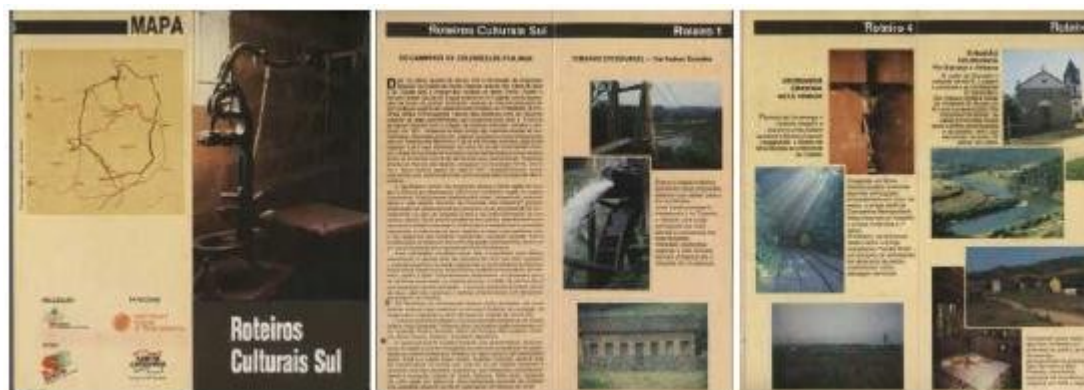
Figura 7 : Folder do Projeto Roteiros Roteiros Culturais Sul.

ROTEIRO 5 – Tubarão – Urussanga via Gravatal e Orleães