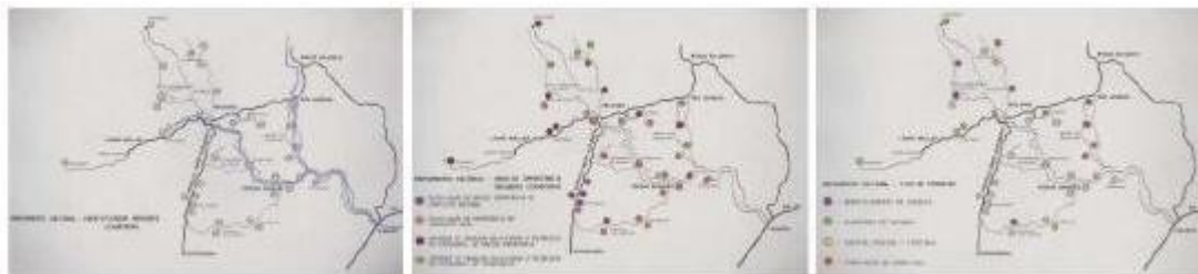
Figura 8 : Mapeamento das edificações de interesse e unidades de produção realizado na região de Orleães.

A FCC, em seus trabalhos na região de imigração italiana no sul do estado, realizou também o reconhecimento da região próxima ao Museu ao Ar Livre em Orleães com prolongamentos em São Ludgero, Pedras Grandes, Lauro Müller e Urussanga (Figura 8). Seu objetivo era 'garantir a produção das características culturais, através de divulgação, comercialização e apoio aos produtores'. (VIEIRA FILHO, 1984)