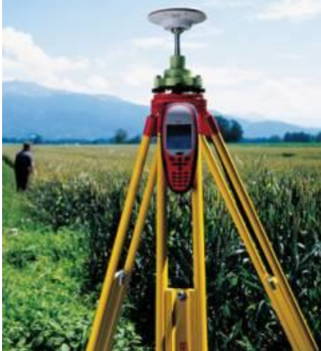
Figura 2 : Aparelho receptor de sinal GPS.

pontos sobre qualquer ponto da superfície terrestre a qualquer hora e condições meteorológicas. Exige-se apenas que não haja bloqueio físico entre as trajetórias dos sinais emitidos pelos satélites com o centro de fase do receptor GPS instalado no ponto a ter suas coordenadas determinadas.