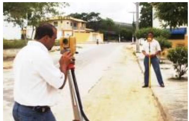
Figura 3 : Ilustra um levantamento planimétrico.

Com a proliferação da utilização da tecnologia GPS integrada aos levantamentos topográficos, esta junção torna os levantamentos cadastrais cada vez mais dinâmicos. Além disto, com o desenvolvimento dos aparelhos topográficos esta interoperabilidade vem se aperfeiçoando cada vez mais. É mister ressaltar que na fase de planejamento dessas medições polares sejam observadas a necessidade de que esses pontos devem ser implantados com intervisibilidade de pelo menos dois a dois, e daí poder ser efetuada as medições polares com coordenadas finais conhecidas. Assim, para os levantamentos topográficos em aglomerados urbanos subnormais, a topografia é auxiliada pelo GPS, medições à trena, prismas, etc; afim de vencer os obstáculos naturalmente existentes nesses espaços.