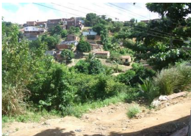
Figura 7 : Casas construídas em cima dos morros.

A comunidade Rosa Selvagem esta situada a oeste do município do Recife, ela se adéqua as definições de aglomerados urbanos, citada nesta pesquisa. Local caracterizado pela alta declividade e sem infra-estrutura urbana. A figura 06 ilustra a área crítica da comunidade que contém um alto grau de declividade, e além das dificuldades de infra-estrutura enfrentadas nesta área.