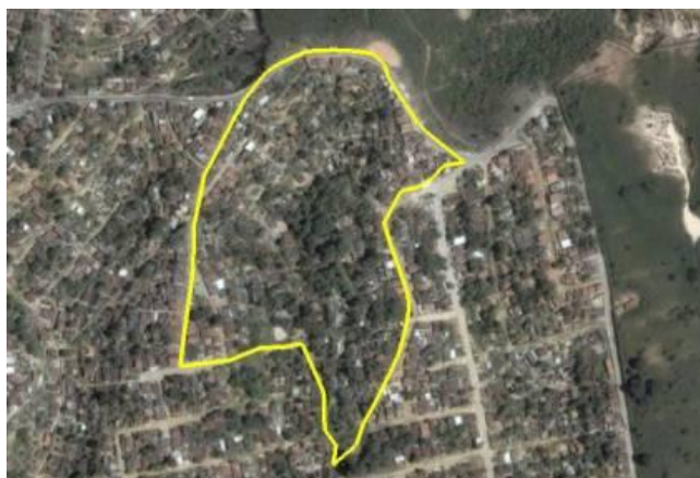
Figura 6 : Área crítica da Comunidade Rosa Selvagem.

A comunidade Rosa Selvagem esta situada a oeste do município do Recife, ela se adéqua as definições de aglomerados urbanos, citada nesta pesquisa. Local caracterizado pela alta declividade e sem infra-estrutura urbana. A figura 06 ilustra a área crítica da comunidade que contém um alto grau de declividade, e além das dificuldades de infra-estrutura enfrentadas nesta área.