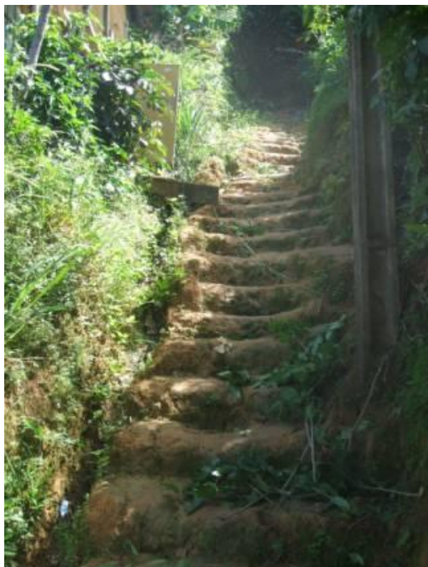
Figura 8 : Becos denominados de ruas.