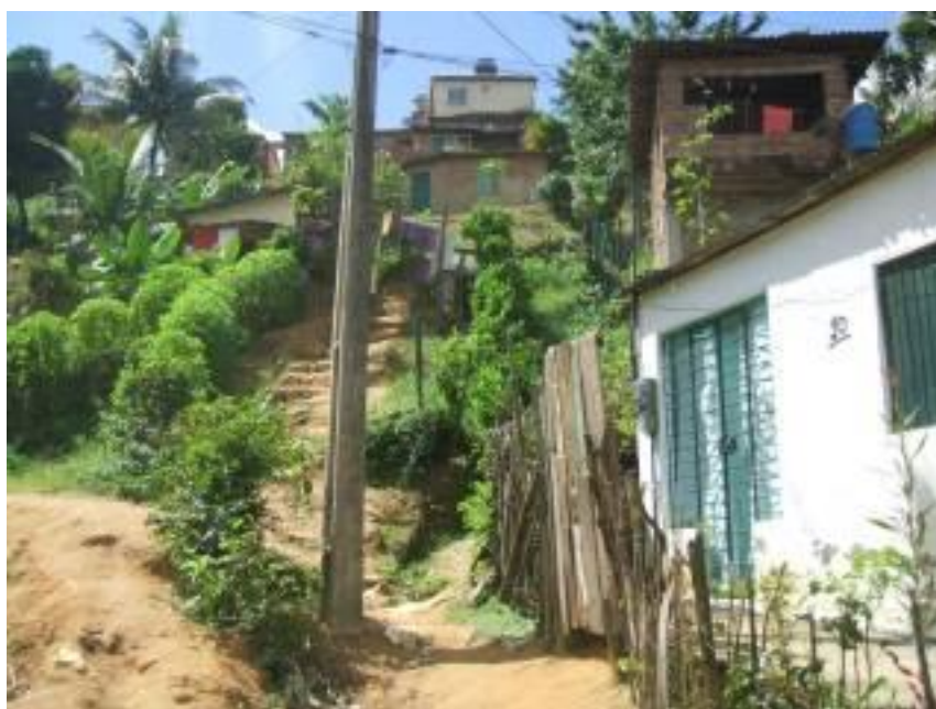
Figura 10 : Má distribuição espacial das casas.

A comunidade enfrenta grandes dificuldades de locomoção, passando por ruas estreitas, sem infra-estrutura, com perigo de ocorrência de deslizamentos.