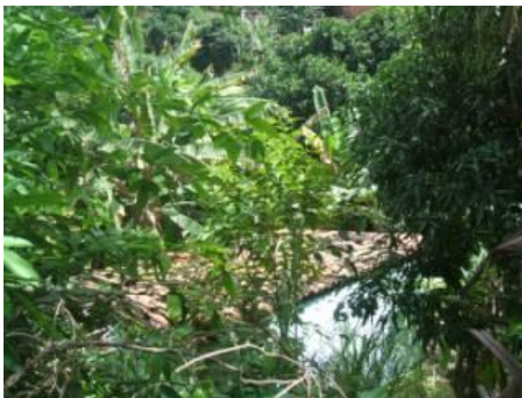
Figura 11 : Cobertura vegetal sobre os imóveis.

Apesar da existência de vários métodos utilizados para levantamento cadastral de imóveis, nem todos se adéquam para o levantamento desta área, devido aos diversos obstáculos encontrados naquela localidade, como por exemplo, a cobertura vegetal das copas das árvores que impede a visualização de alguns imóveis da área, excluindo assim os métodos aeroespaciais.