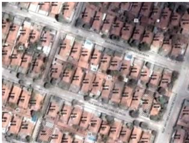
Figura 5 : Imagem de satélite utilizada em prefeituras

As imagens de satélites para aglomerados urbanos subnormais são aplicadas basicamente para identificação das manchas urbanas desses locais. As imagens satelitais de alta resolução como, por exemplo, Ikonos e Quickbird, de resolução espacial submétrica, pode se prestar para definição das feições subnormais, mas se tornam inviáveis pelo alto custo para pequenas áreas.