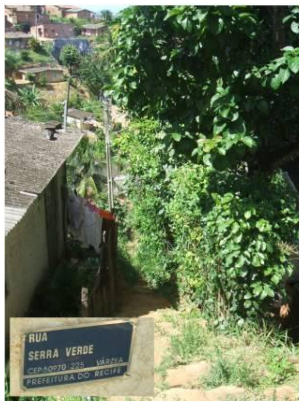
Figura 9 : Rua sem infra-estrutura cadastrada pela prefeitura.

A comunidade enfrenta grandes dificuldades de locomoção, passando por ruas estreitas, sem infra-estrutura, com perigo de ocorrência de deslizamentos.