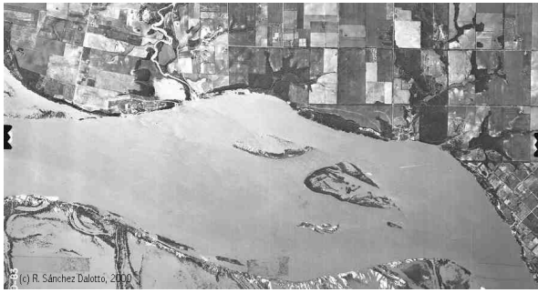
Figura 8 : Hidrografia como controladora da estrutura fundiária Adaptação: Sánchez Dalotto, 2000