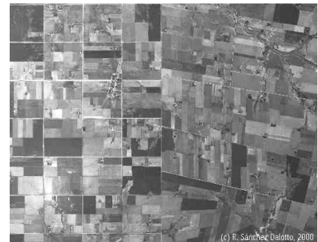
Figura 6: A estrutura fundiária rural condicionada pela política imigratória Adaptação: Sánchez Dalotto, 2000

Posteriormente, com a intensificação das técnicas de produção agropecuária, surgiram problemas de erosão pluvial e hídrica, com perdas consideráveis em termos de solo e volume de colheitas. Este fato, no entanto, não produziu a reestruturação da estrutura fundiária para adequar as condições topográficas à atividade agropecuária, registrando-se só a mudança para técnicas de conservação dos solos.