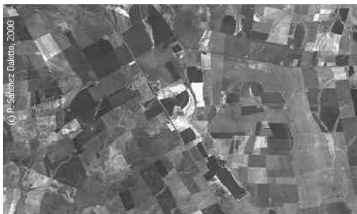
Figura 4 :Vias de comunicação como fator condicionante da estrutura fundiária rural

Destaca-se que o estudo das estruturas fundiárias rurais tem a vantagem de contar com levantamentos sistemáticos do Instituto Geográfico Militar baseado no Cadastro de Imóveis (IGM (1), 1944; IGM (2), 1944; IGM (1), 1968; IGM (2), 1968; IGM (3), 1968; IGM, 1987). Estes, embora desatualizados, são fonte importante para determinação de mudanças temporais na distribuição espacial das propriedades.