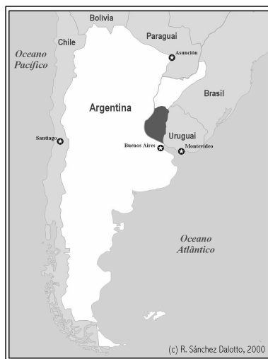
Figura 1 : Localização da área estudada

A conformação da estrutura fundiária rural de um território não é obra fortuita que surge espontaneamente. A mesma está condicionada a fatores positivos e negativos, tanto antrópicos quanto naturais. Em este contexto, caracterizar-se-á a área estudada sob estes critérios.