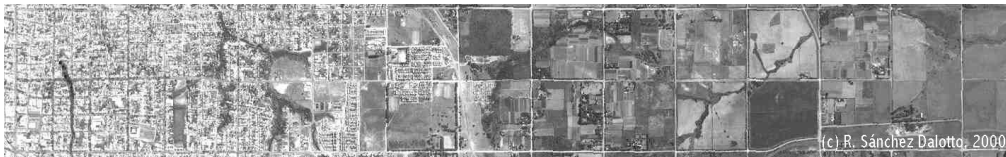
Figura 3 :Transição urbana-rural da estrutura fundiária

Fonte: Dirección Nacional de Catastro - Argentina, 1890 Adaptação: Sánchez Dalotto, 2000