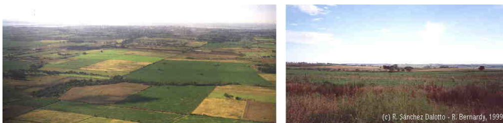
Figura 7: Relevo como controlador da estrutura fundiária Adaptação: Sánchez Dalotto & Bernardy, 1999

Condicionada pela densa rede de drenagem descrita, as propriedades rurais com testada sobre canais principais da rede, tais como os rios Paraná e Uruguai, conformaram-se perpendiculares aos mesmos, acompanhando a sinuosidade do curso. Frequentemente, o rio serviu no passado como via de saída dos produtos rurais com destino aos mercados concentradores que preparavam a mercadoria para consumo interno ou exportação.