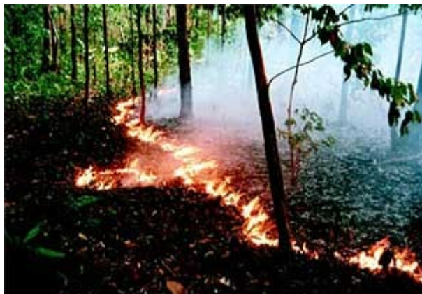
Figura 2: As queimadas na Amazônia respondem por cerca de 3/4 das emissões brasileiras de CO 2 .

As conseqüências das queimadas em áreas de preservação podem ser analisadas em dois níveis, como conseqüências regionais (danos nos locais atingidos) e globais (as implicações mundiais do evento), sendo que ambos os níveis estão interligados.