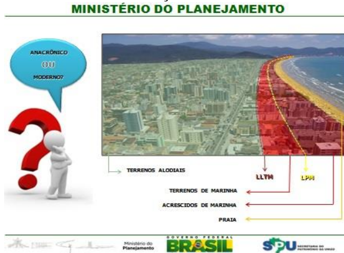
Figura 3 – Critérios da SPU nas demarcações dos terrenos de marinha e seus acrescidos

No exemplo da Figura 3 a seguir, de autoria da SPU, é visto um exemplo sobre os critérios e procedimentos nas demarcações dos terrenos de marinha e seus acrescidos em uma orla marítima da zona costeira, revelando que a cota altimétrica da LPM/1831 não foi determinada corretamente de modo técnico-científico. Ali se observa que o parâmetro de referência não foi a LPM/1831 legal (como determina o artigo 2º do Decreto-Lei Nº 9.760/46), porque foi determinada outra linha (linha interrompida em cor amarela) apelidada de “LPM/1831” e localizada sobre as áreas edificadas da urbanização consolidada. Com isto, as propriedades particulares alodiais foram invadidas, atribuindo-se os seus domínios plenos à União, pela simples declaração do agente da administração pública. Esta afirmação é a prova real e concreta da ilegalidade praticada pela SPU.