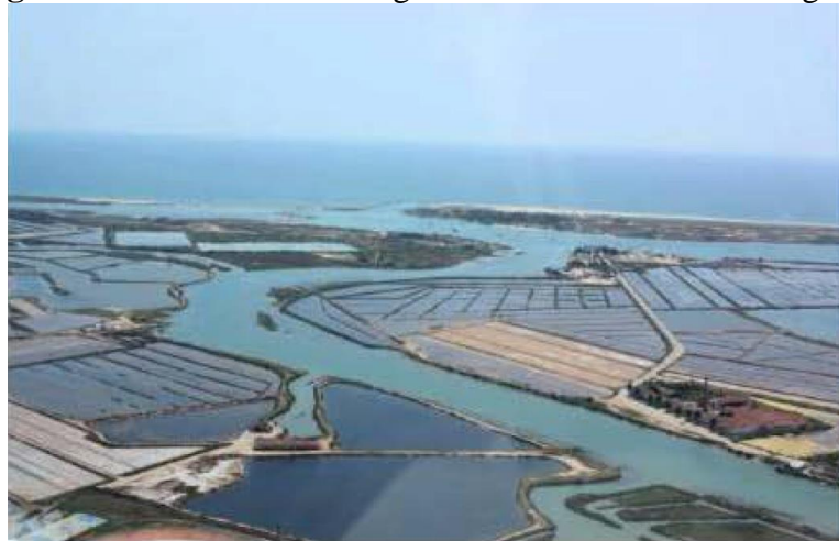
Figura 2 - Marinhas de Portugal: Ria Formosa - Tavira/Algarve