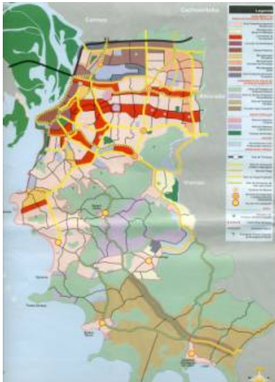
Figura 3 : Modelo Espacial

O Modelo Espacial (Fig. 03) propõe a estruturação de macrozonas (Fig. 04) com critérios de atuação em macroescala, para enfrentar a ampla ocupação urbano-metropolitana contínua, e sua inter-relação com um território rural pouco atendido e em acelerado processo de mudança. Para que isso ocorra, é adotado o conceito de Corredores de Centralidade, que assumem, através da potencialização dos espaços abertos de interesse social, a descentralização que as integra em grandes centralidades lineares, estruturando a cidade da periferia e relacionando-se com a área metropolitana adjacente.