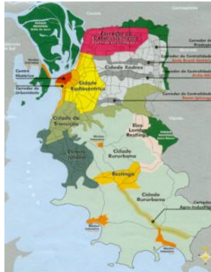
Figura 4 : Macrozonas

O Plano Diretor, como proposta de modelo para o Desenvolvimento Urbano, se estrutura a partir de alguns princípios. São eles: