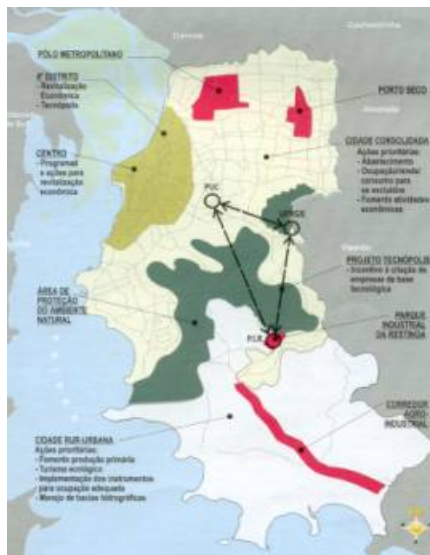
Figura 2 : Promoção Econômica