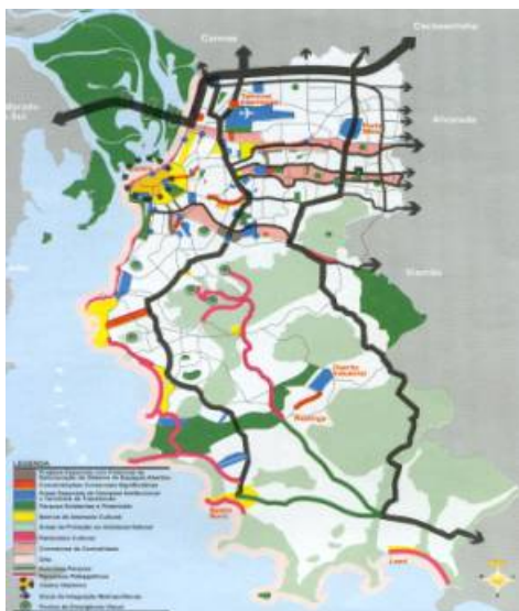
Figura 1 : Estruturação Urbana