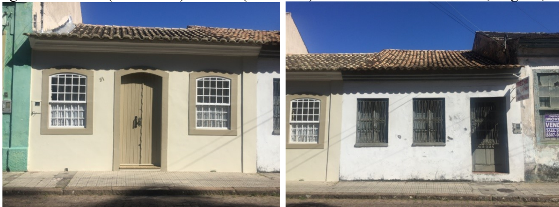
Figura 2 – casa 1 (residencial) e casa 2 (comercial) - Rua Voluntário Fermiano, Laguna, SC