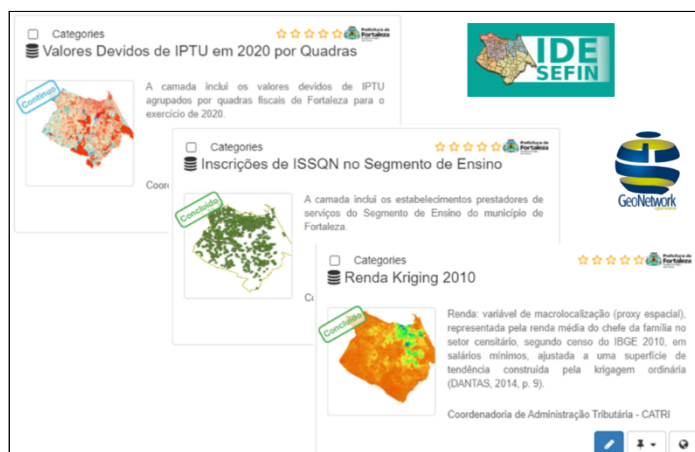
Figura 4 - Exemplo de metadados e suas descrições do catálogo de metadados da IDESEFIN

Último produto, mas não menos importante da IDE-SEFIN, é o catálogo de metadados gerenciado pela aplicação Geonetwork. Responsável pela catalogação das camadas disponíveis, a aplicação fornece um ambiente completo para gestão das informações que descrevem os dados. Fornece o padrão ISO 19115, que é o padrão de metadados oficial adotado pela CONCAR para o armazenamento e distribuição dos metadados geoespaciais, ou seja, a base mínima de elementos que deve ser comum a todos os perfis de metadados no Brasil, de forma que seja garantido a interoperabilidade entre as mais diversas implementações que se propõem em disseminar informações espaciais, promovendo enfim, como aponta o Decreto nº 6.666 de 2018, sua documentação, possibilitando a busca e exploração dos dados espaciais correspondentes (art. 2º, inciso II).