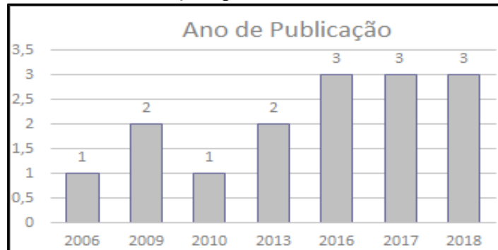
Gráfico 1: Publicações por ano em nível internacional

tocante ao mapeamento geotécnico neste período, houve um leve aumento a partir da segunda década.