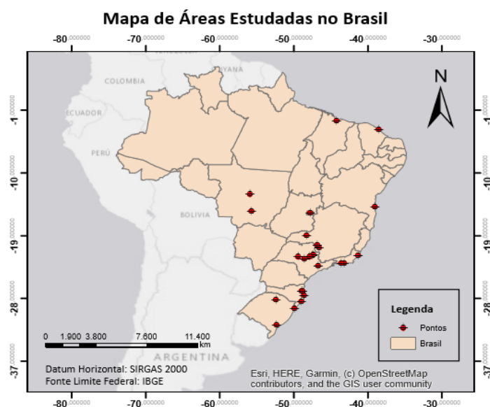
Figura 3 - Localização das áreas estudadas no Brasil

Na triagem dos artigos obteve-se 27 trabalhos de âmbito nacional. Da amostra total para nível nacional, 25 artigos são considerados empíricos, apresentando informações e resultados acerca das áreas de estudos determinadas. E dois artigos enfatizam a teoria. A localização das áreas estudadas em território brasileiro está identificada por meio da Figura 3.