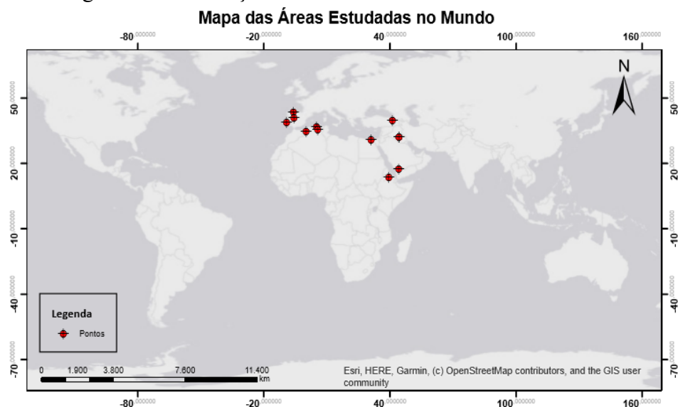
Figura 2 - Localização das áreas estudadas no Mundo

Os primeiros resultados dizem respeito à quantidade de artigos encontrados em áreas de estudos fora do Brasil, conforme Figura 2. Com uma amostra final de 14 artigos, no que tange ao enquadramento do trabalho, há a preponderância de 12 artigos teóricos-empíricos, com áreas de estudos delimitadas, apresentando dados relevantes ao contexto estudado, e dois artigos abarcando ensaios teóricos.