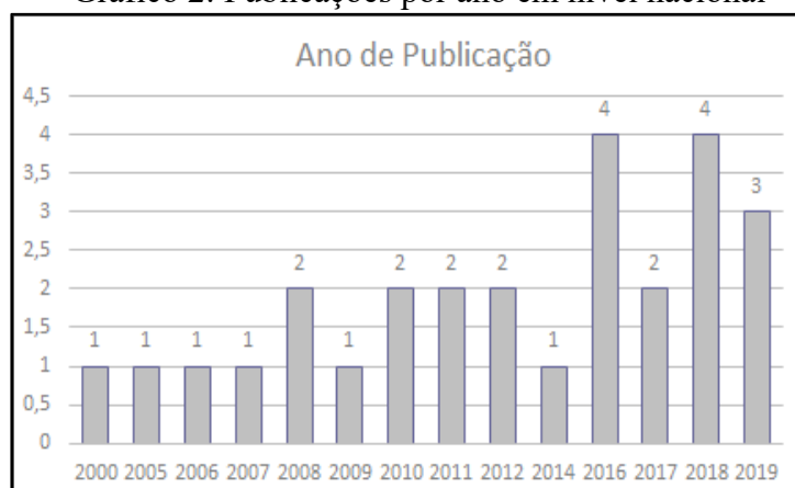
Gráfico 2: Publicações por ano em nível nacional

Em relação ao ano de publicação, ressalta-se uma maior quantidade nos últimos 5 anos, conforme o Gráfico 2 abaixo. Já nos anos de 2001 a 2004, 2013 e 2015 não houve publicações sobre o tema abordado.