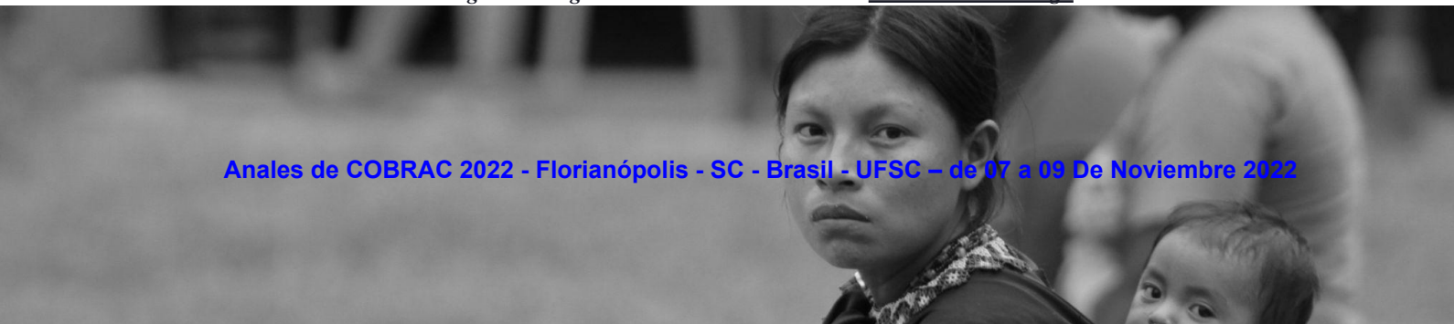
Figura 1 Indigena Chamí Risaralda

Keywords: Legal security; Cadastre; Public politics; Natives.