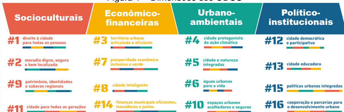
Figura 1 – Dimensões dos ODUS

Podem ser reunidos em quatro dimensões, conforme disposto na Figura 1.