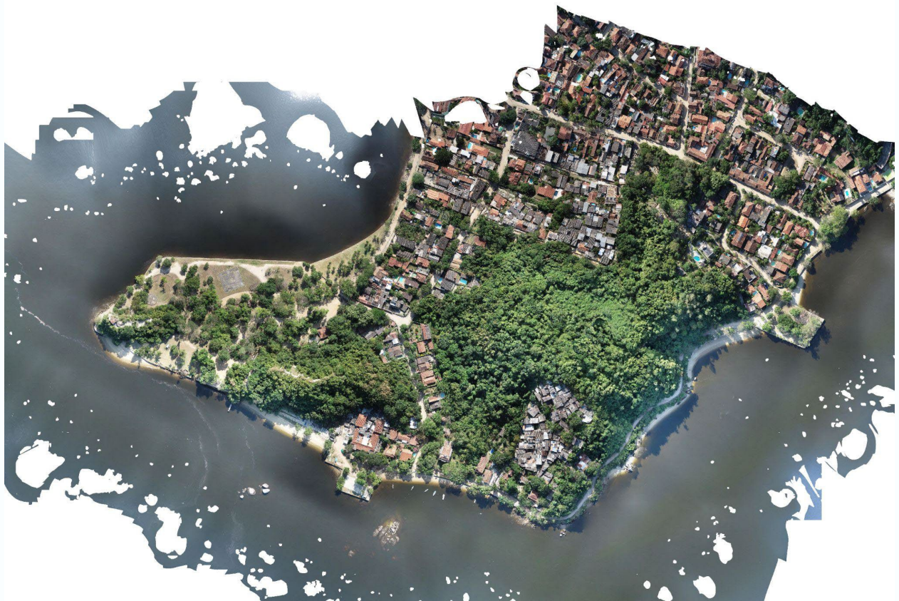
Figura 5 – Ortoimagem após processamento