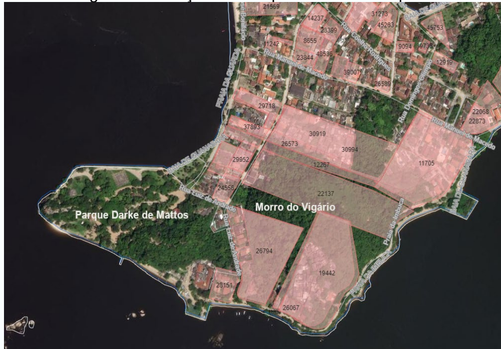
Figura 1 - Serviço Geopal para a Ilha de Paquetá