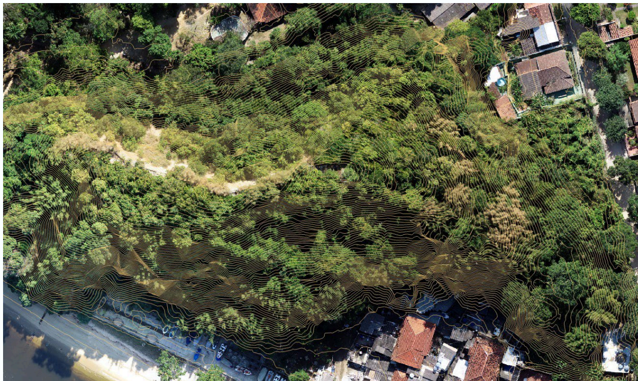
Figura 7 – Curvas de nível sobrepostas à ortoimagem