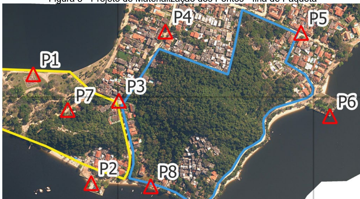
Figura 3 - Projeto de Materialização dos Pontos - Ilha de Paquetá