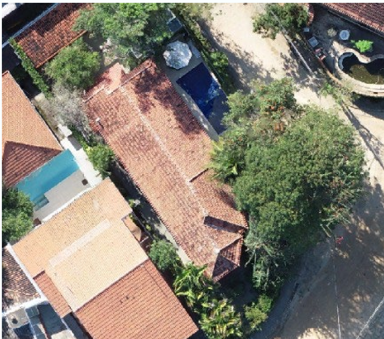
Figura 6 – Extrato da ortoimagem

Mediante análise visual, as ortoimagens geradas apresentaram boa resolução espacial (na faixa de 3 cm/pixel) e radiometria adequada às aplicações (Figura 6). Especialmente em áreas de vegetação densa, a ortoimagem apresentava inicialmente alguns artefatos, que demandaram o reprocessamento fotogramétrico com intervalos de confiança mais rígidos e uma busca por pontos homólogos mais detalhada. A Figura 6 já apresenta a segunda versão desse processamento, com um aspecto visual adequado à necessidade do trabalho em pauta.