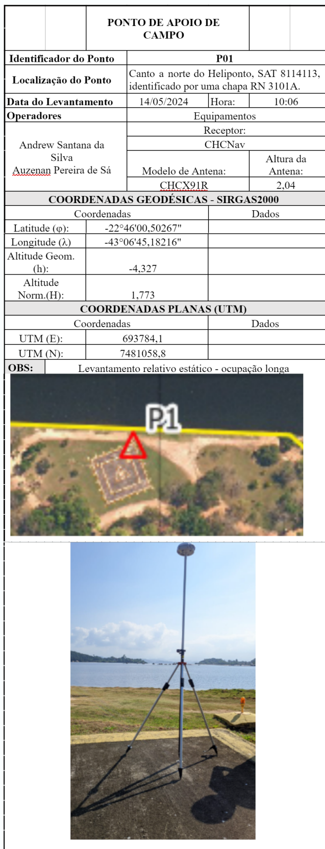
Figura 4 – Exemplo de monografia de ponto de controle levantado