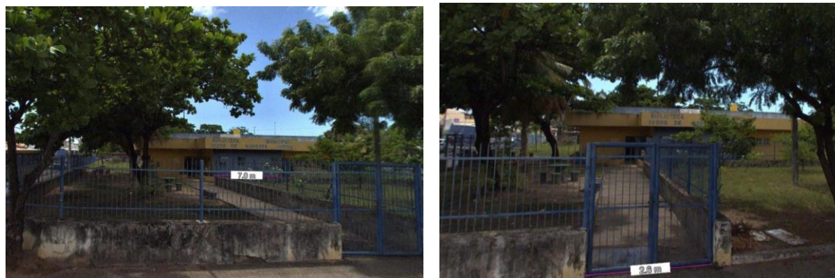
Figura 5 – Medida na fachada da Biblioteca Municipal no software