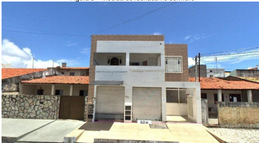
Figura 3 – Medida de fachada no software