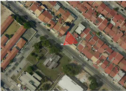
Figura 6 – Momento da medida de fachada no software.

É importante destacar que o procedimento de medição requer cuidados específicos, especialmente ao utilizar o software. Observou-se que a medição horizontal deve ser realizada preferencialmente no centro da distância horizontal do imóvel, ou seja, com o eixo ótico da tomada da foto próximo da ortogonal à fachada do imóvel. Caso a medição seja efetuada nas extremidades (inicial ou final) dessa distância (figura 6), a precisão da medida pode ser comprometida. Essa questão representa um ponto crítico que deve ser cuidadosamente considerado. Na Tabela 2, é possível observar algumas discrepâncias entre as medições realizadas in loco pelas duas equipes e aquelas obtidas via software. Isso sugere que, durante a captura da medida no software, essa particularidade provavelmente não foi devidamente considerada, resultando em variações nos resultados.