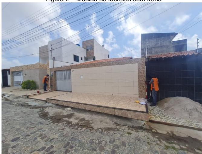
Figura 2 – Medida de fachada com trena

As medidas das distâncias referentes à testada dos lotes foram realizadas a partir das divisas físicas destes, sendo a maioria pelo muro. Essas medições foram realizadas por duas equipes de estudantes da UFBA, de forma direta com trena, tomando-se o cuidado de se minimizar o erro de catenária. O objetivo da repetição das medições foi a minimização dos erros inerentes a esse tipo de técnica, possibilitando a rejeição de medidas inconsistentes. Já as medidas das mesmas fachadas no software foram realizadas no escritório da Secretaria da Fazenda de Aracaju (SEMFAZ), com a orientação de servidor da instituição. Isso permitiu uma verificação cruzada dos dados. Essa abordagem integrada foi crucial para assegurar a consistência e confiabilidade dos dados coletados. A utilização de feições de validação bem definidas e estáveis, como fachadas de construções e muros, também contribui para a robustez do processo.