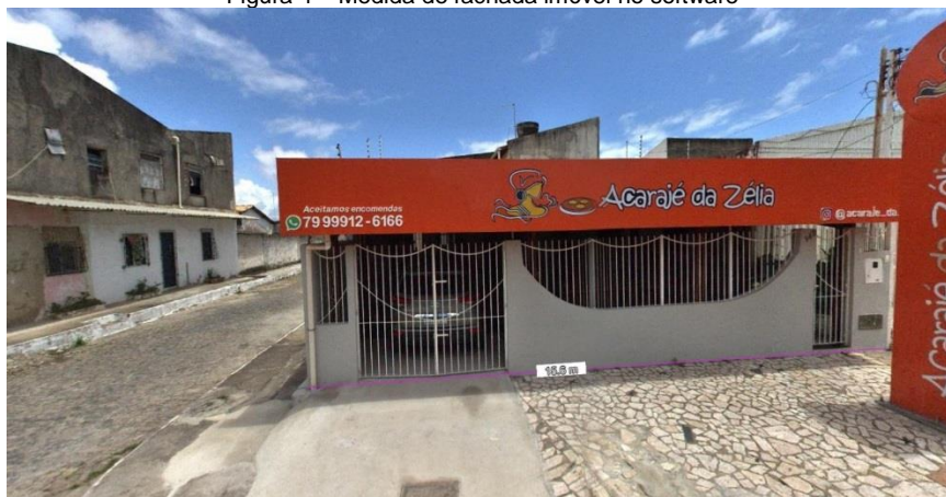
Figura 4 – Medida de fachada imóvel no software