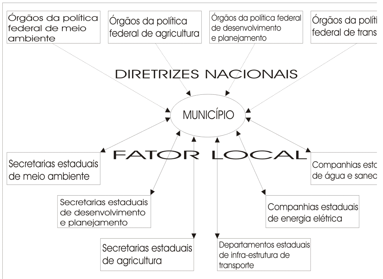
Figura 1 : Situação do município em relação às influências federais e estaduais.

Situação do município em relação às influências federais e estaduais. A Figura 1 mostra a integração entre as diversas instituições que influenciam o planejamento, tendo o município como célula-base e onde, de fato, as políticas são implementadas. A partir de diretrizes nacionais, municípios e órgãos estaduais devem interagir de forma a não haver conflitos de interesse, tampouco conflitos legais. A proximidade entre as instituições estaduais e o município atende às características, princípios e necessidades definidas pelo fator local. (As setas apontam o sentido da interação).