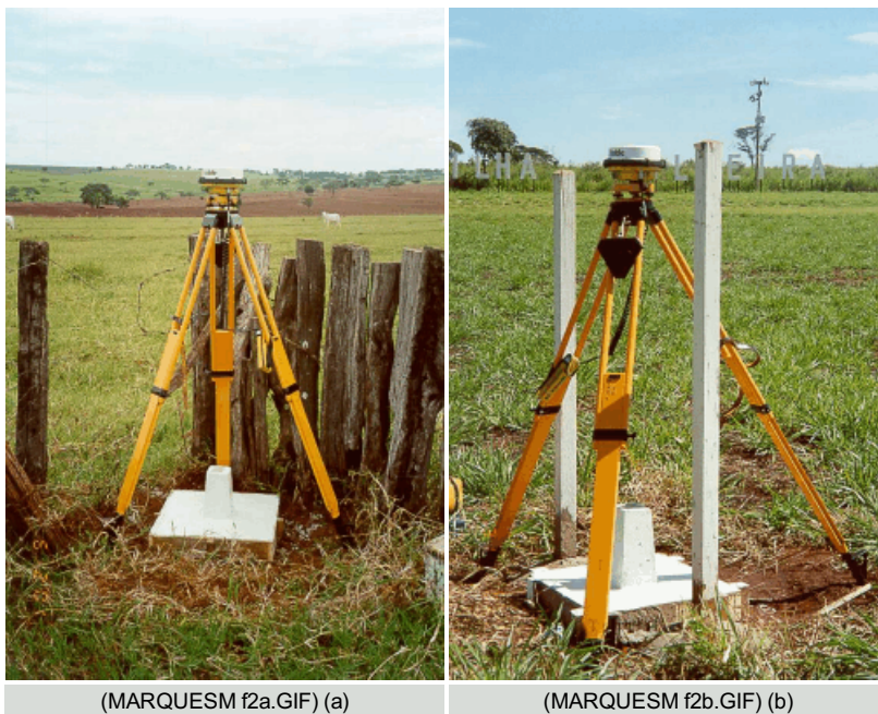
Figura 2 : Marcos em forma tronco de pirâmide da RGMIS

Nesta etapa foram materializados os marcos de concreto construídos em concreto de 15 Mpa, apresentando-se na forma de tronco de pirâmide (Mod. PMIS) contendo placa de identificação que foram concretados "in-loco" e depois pintados.