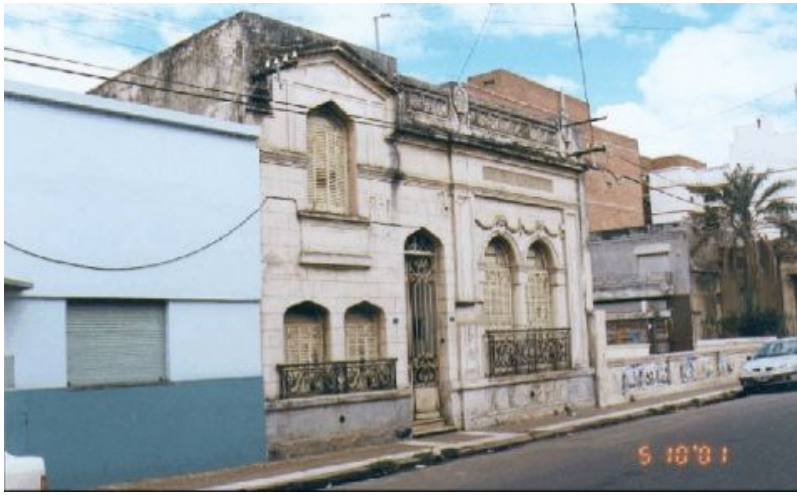
Figura 1: Fachada de la Construcción.

Ante esta situación, el Poder Judicial consideró adecuado realizar un convenio con la Universidad Nacional del Litoral (UNL), para que la cátedra de Fotogrametría II de la carrera de Licenciatura en Cartografía -perteneciente a la Facultad de Ingeniería y Ciencias Hídricas (FICH)- realice dicho trabajo. El mismo fue realizado como parte de las actividades propias de la cátedra.