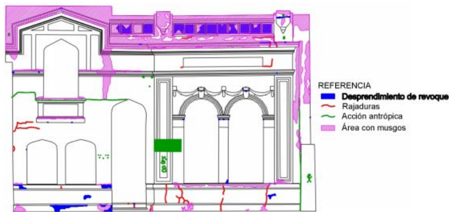
Figura 5: Cartografía Patológica de la Fachada.