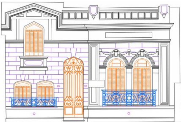
Figura 4: Cartografía de la Fachada.

Finalmente, cada uno de los elementos fue interpretado y cartografiado en la pantalla de la computadora. Además de los elementos anteriormente presentados, fueron también cartografiadas las patologías presentes en la fachada, como ser: principales rajaduras, desprendimientos de revoque, áreas modificadas por acción antrópica y elementos fijados a la fachada. (Figura 5).