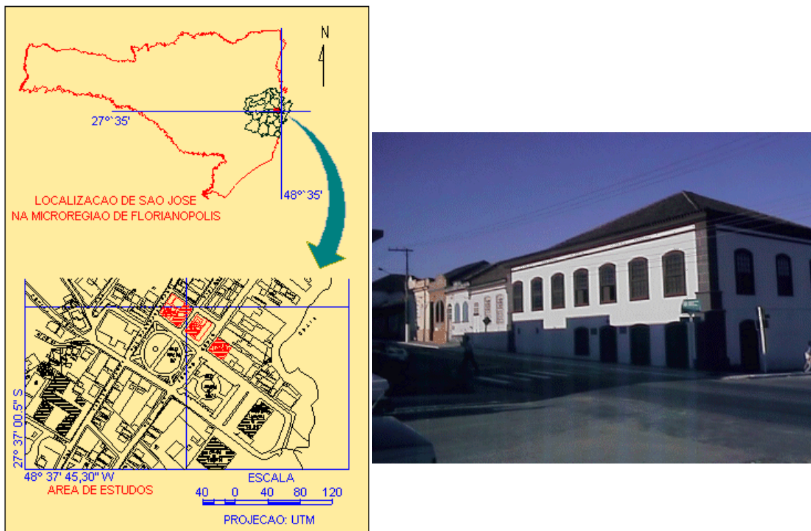
Figura 1. A) Área piloto, B) Imagem da Rua Dr. Homero Gomes