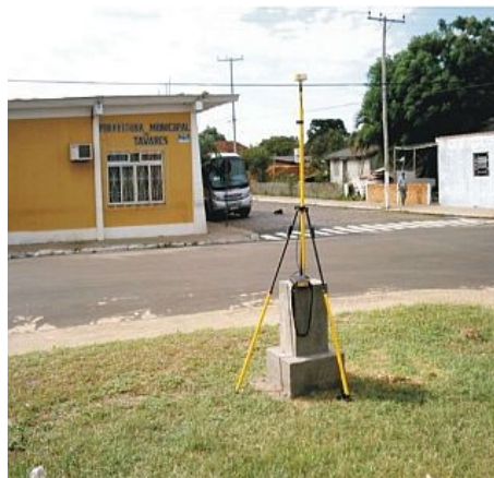
Figura 4 : Marco de Tavares, situado na Praça Central do Município