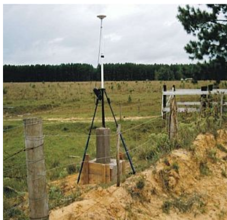
Figura 7 : Marco do Rincão, situado na intersecção da estrada que vai para o Rincão do Cristóvão Pereira e a localidade de butiá, em frente à Fazenda Querência.