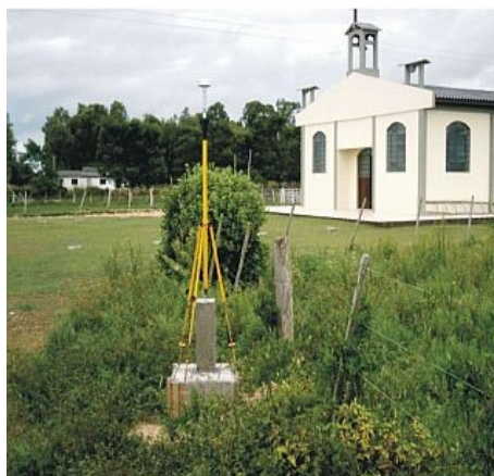
Figura 6 : Marco da Tapera, situado na localidade de Tapera, junto à Igreja.