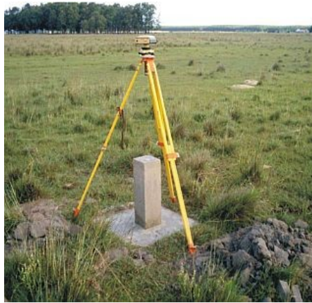
Figura 15 : Marco Capão D'Areia