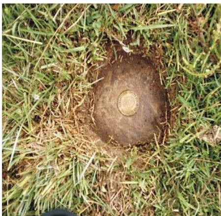
Figura 12 : RN_67, implantada pelo SGB, situada na localidade de Olhos D'água, entre a sede do município e a localidade de Tapera, na propriedade do Sr. Domingos.