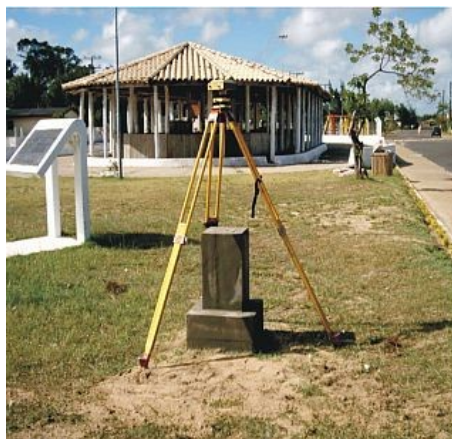
Figura 14 : Marco Tavares