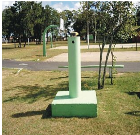
Figura 13 : Marco Mostardas