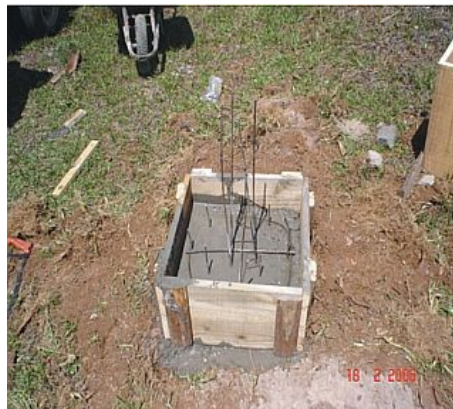
Figura 3 : Concretagem do Marco