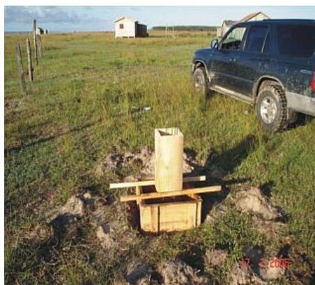
Figura 10 : Marco da Barra, situado na vila dos pescadores na Barra da Lagoa do peixe.