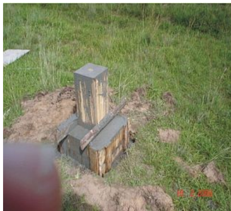
Figura 9 : Marco Capão Comprido, situado nesta localidade, no terreno da Igreja à margem da RST-101.