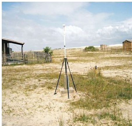
Figura 5 : Marco do Farol, situado no Balneário do Farol.