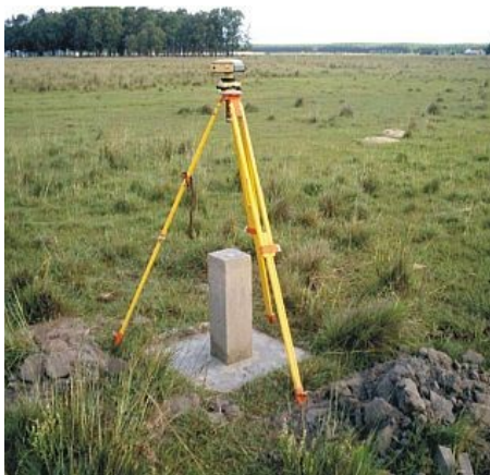
Figura 11 : Marco Capão da Areia, situado nesta localidade, próximo a RST-101, na propriedade de Ângelo Fontanive.