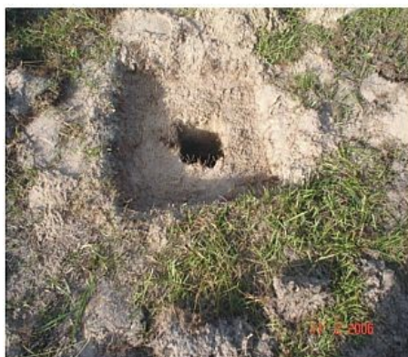
Figura 1 : Preparação do local do Marco