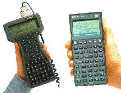
Fig. 4: Coletor Husky [5] e uma calculadora HP funcionando como coletora de dados utilizando o sistema da TOPCON [2]

Desta forma, é mais sensato falar em sistemas coletores de dados, os quais são compostos por programas (para coleta, gerenciamento e em alguns casos específico também processamento dos dados) e equipamentos.