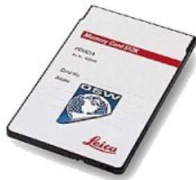
Fig. 1: Cartão PCMCIA usado pelo TPS-System 1000 da Leica [1]

Modernamente também se tem empregado os cartões PCMCIA ( Personal Computer Memory Card International Association ), que funcionam como uma expansão de memória, tendo capacidades de armazenamento variáveis, como 512 Kb, 2 ou 4 Mb, etc. São do tamanho de um cartão de crédito o que facilita o seu armazenamento e uso. Logicamente os equipamentos que utilizam este sistema possuem acessórios (drives) específicos para a leitura e gravação das informações coletadas. Também são utilizados para a leitura de programas de cálculo e para armazenamento específicos.