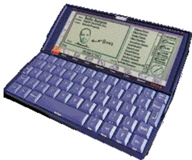
Fig. 5: Computador handheld da Psion [6]

Para todas as formas de registro eletrônico, um ponto a ser considerado é como os dados armazenados são transferidos ou convertidos para o uso em programas de processamento. Uma primeira hipótese é que o programa entende o padrão utilizado; então os dados podem ser transferidos diretamente. Uma segunda, mais complicada, seria a necessidade de efetuar uma conversão de formato de armazenamento dos dados para que os mesmos sejam entendidos pelo programa. Neste caso todos os cuidados devem ser tomados para evitar erros na conversão.