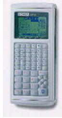
Fig. 3: Coletor de dados SDR 33 da Sokkia [4]

CINTRA (1993) realiza uma analogia entre os coletores de dados e as calculadoras que facilita o entendimento do funcionamento dos mesmos: " possuem memórias em abundância, teclado alfanumérico para a introdução dos dados, são programáveis ou dispõem de módulos de programas que podem ser adicionados, visores de cristal líquido, funções pré-definidas, interface para outros equipamentos, são portáteis e usam pilhas ". De fato, algumas empresas apresentam sistemas para a automação do registro dos dados que na realidade nada mais são que calculadoras HP executando programas específicos.