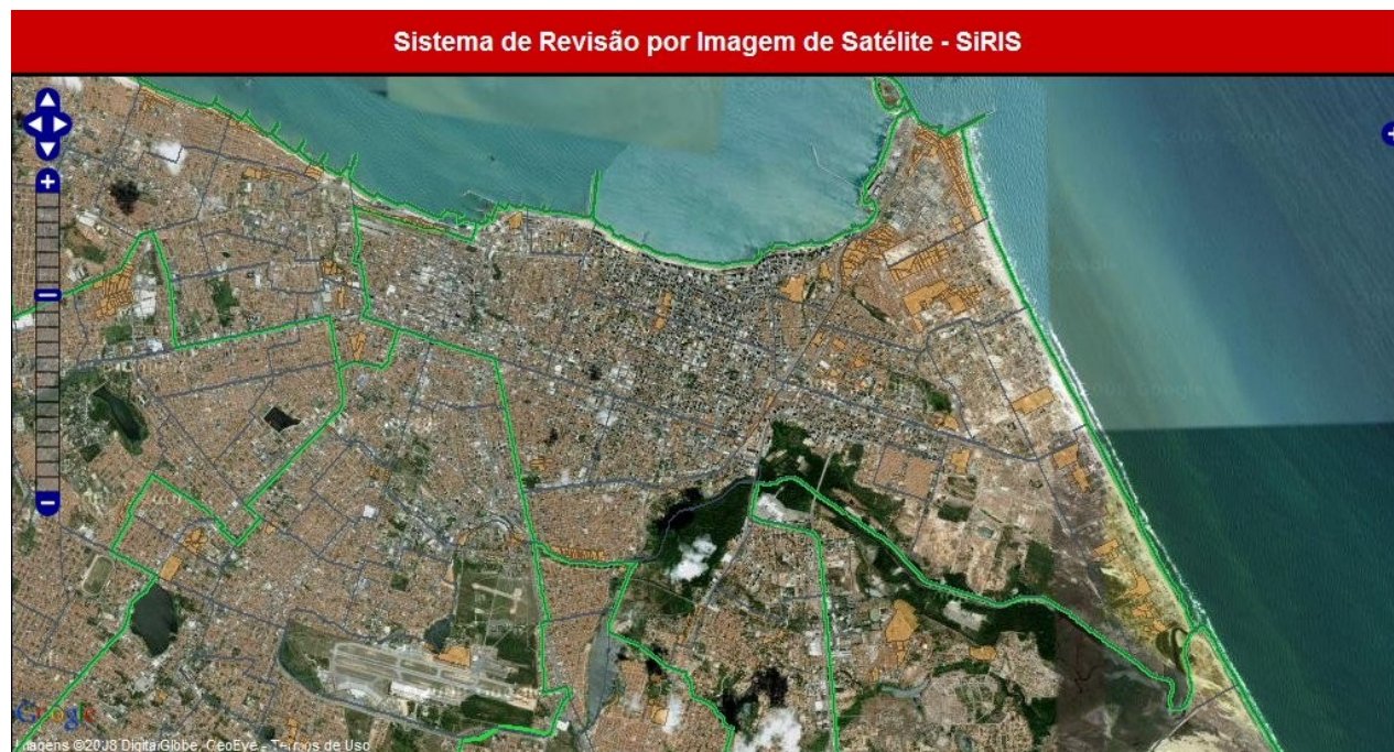
Uchoafcf2.jpg: Tela do SiRIS.

A revisão dos trabalhos de campo exigiu um sistema capaz de analisar e criticar o banco de dados que foi montado durante o andamento do projeto. Para este objetivo, optou-se pela integração entre o banco de dados e o API do Google Map, através do OpenLayers. Esta integração foi necessária, pois não havia ortofotos recentes do município de Fortaleza.