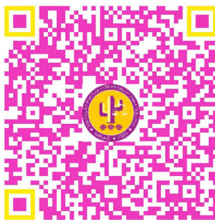
Figura 1: QR Code para acesso ao Instagram do Projeto.

Nesse contexto, surgiu como proposta a divulgação destes materiais, feitos em linguagem acessível, decodificando o direito, através das mídias sociais, sobretudo no Instagram do Projeto (@mediacaoorientacaouefs) – acesso através do QR Code abaixo –, que já existia, mas limitava-se à divulgação de palestras, cursos, rodas de conversas e outros eventos promovidos pelo grupo.