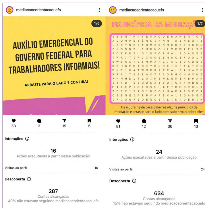
Figura 3: Alcance de uma das primeiras publicações após o início da pandemia, postada em 08 de abril de 2020, em contraposição com o alcance de uma publicação postada neste ano, em 06 de abril - Imagem montada através dos dados fornecidos pelo Instagram.

Assim, conclui-se que, embora a situação da pandemia tenha trazido incontáveis adversidades e perdas, a produção de materiais digitais versando sobre os mais variados tipos de direitos, descomplicando-os, em linguagem acessível, tem possibilitado a interação da academia com a comunidade, podendo munir esta última de conhecimento para que possa fazer valer seus direitos. Dessa forma, o Projeto Mediação Popular e Orientação sobre Direitos da UEFS tem conseguido atingir seu escopo de fazer extensão através das mídias sociais, tendo este meio se mostrado, por seu alcance, como uma possibilidade mesmo após o retorno dos atendimentos presenciais.